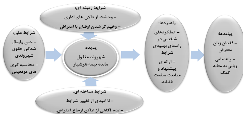
نمودار ۱- مدل پارادایمی کنش‌های رفتاری در فضای شهری

مدل پارادایمی رسم شده، برگرفته از شش وضعیت تعیین‌کننده‌ی کنش‌ها و رفتارهای مصاحبه‌شوندگان در فضای شهری و ارتباطات مدنی می‌باشد که از تجمیع این مباحث، مدل مربوطه رسم گردیده است.