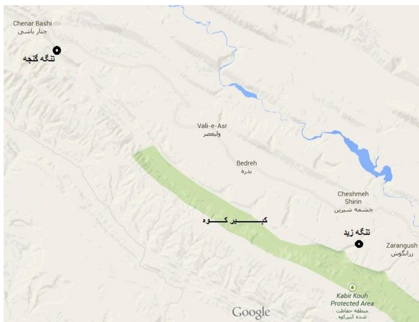
شکل ۱: موقعیت تنگه زید و تنگه گنججه

۱. انبارهای تنگه زید: در جنوب روستای زید، یکی از روستاهای بخش هندمینی از توابع شهرستان بدره، تنگه صخره‌ای بسیار زیبایی دیده می‌شود که بر روی دیواره‌های صخره‌ای دو طرف ورودی، به ویژه ضلع غربی این تنگه حدود ۴۰ انبار در ترکیب و هماهنگ با دیواره صخره‌ای کوه ساخته شده است که از زیبایی‌های هنر معماری منطقه در ادوار گذشته به شمار می‌آیند (مظاهری، ۱۳۹۰: ۴۸). این سازه‌ها در موقعیت طول جغرافیایی E 33^{\circ} 14' 40'' و عرض جغرافیایی: N 47^{\circ} 11' 12'' و در فاصله تقریبی ۲۵۰-۲۰۰ متری جنوب غرب روستای زید و در جنوب شرقی شهرستان بدره واقع‌اند (همان). این انبارها اولین بار در فصل سوم بررسی و شناسایی باستان‌شناسی شهرستان دره شهر در سال ۱۳۸۵ ش. با نام «مجموعه معماری روستای امامزاده زید» شناسایی و مورد مطالعه قرار گرفت (حسینی، ۱۳۸۶: ۱-۱۲). بررسی‌ها حاکی از این است که پیش‌تر در منابع هیچ اشاره‌ای به انبارهای تنگه زید نشده است.