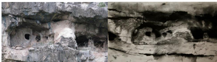
شکل ۷: طرح نمونه انبارهای تنگه گنجه (مظاهری، ۱۳۹۴: شکل ۲)

که از بارش باران و نفوذ رطوبت در امان باشند. از طرف دیگر موقعیت سازه‌ها کاملاً آفتابگیر است. ارتفاع بعضی از سازه‌ها از کف پادامنه به بیش از ۱۰ متر می‌رسد و غیر قابل دسترسی هستند. در گذشته برای ساخت آنها از پلکان و نرده‌های چوبی بهره برده‌اند و در برخی موارد نیز بر روی کف غارها اقدام به ساخت تاپو نموده‌اند. ارتفاع این تاپوها حدود ۳-۲/۵ متر است و قطر آنها در پائین به حدود ۳ متر می‌رسد، لیکن در بالا به شکل کله قندی کم شده و حالت گنبدی به خود گرفته‌اند.