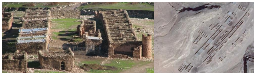
شکل ۴: روستای قدیمی زید (مظاهری، ۱۳۹۴: تصویر ۲) شکل ۵: تصویر هوایی از روستای قدیمی زید (مظاهری، ۱۳۹۰: تصویر ۳)

انبارهای تنگه گنجه بر خلاف انبارهای تنگه زید، به شکل پراکنده بر روی دیواره صخره‌ای به طول حدود ۲۵۰ متر ساخته شده‌اند. شکل سازه‌ها، نحوه قرارگیری بقایای معماری، موقعیت آنها و همچنین ارتفاع آنها از کف پادامنه متفاوت است. در ابتدای ضلع غربی دیواره صخره‌ای تنگ گنجه و بر روی دیواره صخره‌ای آن چند غار وجود دارد که در درون و کف غارها و نیز در پیرامون آنها بر روی دیواره تنگه، در نقاطی که در اثر فعالیت‌های زمین‌شناسی فرورفتگی‌های کوچک اشکفت مانندی ایجاد شده و انبارهای متعددی در ترکیب با ناهمواری‌های دیواره صخره‌ای ساخته شده است. در واقع، علاوه بر این که درون غارها انبار ساخته شده، بر روی دیواره صخره‌ای نیز در هر قسمتی که فرورفتگی طبیعی وجود داشته و مناسب تشخیص داده شده، در سطح آن و بر روی فرورفتگی انبار ساخته‌اند و از فضای درون فرورفتگی‌ها برای ساخت انبار استفاده شده است. با مطالعه شکل و اندازه انبارهای تنگه گنجه متوجه می‌شویم که برخی از انبارهای تنگ گنجه جهت ذخیره غلات و احتمالاً برخی دیگر جهت ذخیره علوفه احشام ساخته شده‌اند. انبارهای تنگ گنجه به شکل پراکنده و تنک هستند و غالباً حجم سازه‌ها کوچک و ناهمگون بوده و صرفاً بر اساس شکل ناهمواری‌های دیواره صخره‌ای و نیز وضعیت درون غارها ساخته شده‌اند. از آنجایی که فرورفتگی‌های اشکفت مانند کم عمق روی دیواره صخره‌ای به شکل افقی گسترش یافته‌اند، بیشتر سازه‌ها نیز در راستای این فرورفتگی‌ها و به شکل افقی گسترش یافته‌اند. عمق فرورفتگی‌های دیواره صخره‌ای کوه و ارتفاع آنها یکسان نیست. انبارها با توجه به عمق و ارتفاع فرورفتگی‌ها و در راستای آنها در نقاطی ساخته شده‌اند