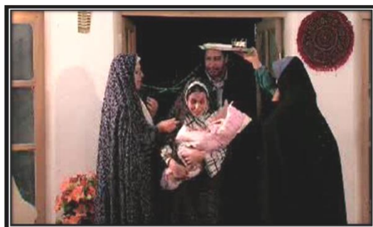
تصویر (۱): ورود زائو به منزل

(معمولاً غسل در حمام روز دهم زایمان انجام می‌شود). این اعتقاد در باورهای دینی و پاک و مباح بودن آب و نجس بودن خونی ریشه دارد که بر اثر زایمان از زائو دفع می‌شود. همچنین از بدو تولد تا ۱۰ روزگی، دو دست بچه را در قنداق می‌بندند تا دست‌هایش کج نشود و پیشانی‌اش را با دستمال می‌بندند تا به اصطلاح «قُر» یا «برآمده» نشود و می‌گویند «بچه آب نبسته» و زود «وامیریزه» (یعنی استخوان‌هایش محکم نشده‌اند و شکل اصلی را از دست می‌دهند). در گذشته شخصی که قصد رفتن به خانه زائو و شرکت در مراسم زایمان را داشت، هدیه‌اش را که بر اساس قرابت و رابطه متفاوت بود، در سینی می‌گذاشت و روی آن را با بقچه‌ای می‌پوشاند و توسط شخص دیگری به منزل زائو می‌فرستاد. گیرنده هدیه موظف بود از آورنده هدیه پذیرایی کند و پس از برداشتن هدیه، مقداری دانه هل در سینی بریزد و همراه با انعامی به آورنده هدیه برگرداند. پس از مدت کوتاهی فرستنده کادو به دیدار زائو می‌رفت. به کادو زایمان «چشم‌روشنی» گویند و آن شامل سند مالکیت، پول، طلا و نقره و پارچه و ...، همراه با یک یا دو عدد کله قند بود. امروزه پارچه و کله قند و فرستادن هدیه، به کلی منسوخ شده است و هر کس خودش هدیه را به زائو می‌دهد.