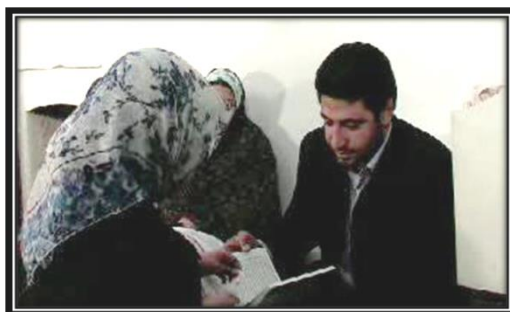
تصویر (۶): برداشتن نام نوزاد از وسط قرآن

پدربزرگ پدری وی باشد تا نام جد و آباء نوزاد حفظ شود. به طور کلی در هر جامعه‌ای و در مقیاس کوچک‌تر در میان هر خانواده، نام‌های انتخابی برای هر فرد می‌تواند نشان‌دهنده فرهنگ و اعتقادات و باورهای آن‌ها باشد. در واقع نام‌گذاری نمادی از باورهای افراد است.