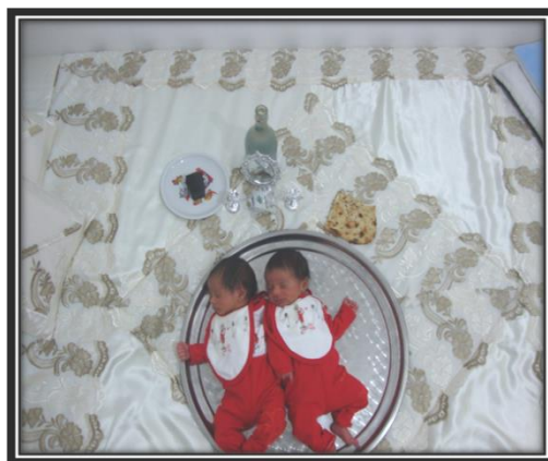
تصویر (۲): نوزاد بر روی سینی

در این شب لباسی که به تن نوزاد می‌کنند، حتماً باید قرمز باشد. سپس نوزاد دست به دست مهمانان می‌گردد و طفل را روی سینه می‌گذارند و هر کدام از آنان هدایای خود را به عنوان چشم‌روشنی درون سینی می‌گذارند.