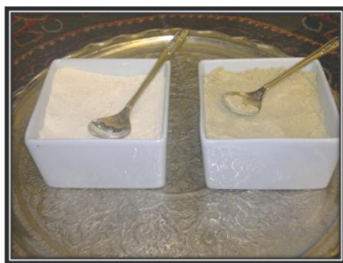
تصویر (۳): قهوه پسته و قهوه سفید

دو رنگ تهیه می‌شد: قهوه سیاه که مخلوطی از قهوه، گشنیز، شکر و هل است و قهوه سفید که از ترکیبات متعددی درست می‌شود. این قهوه را نیز چند نمونه درست می‌کنند: ۱- نارگیل، آرد نخودچی، هل و شکر ۲- نارگیل و شکر ۳- مغز بادام، هل، شکر و آرد نخودچی. قوتو یا قاووت نیز مخلوطی از قهوه، شکر، بذر کتان، تخم کاهو، تخم خرفه، هل باد، هل رسمی، جو، موردانه و روپاس است. قهوه پسته نیز با مغز پسته، شکر و هل تهیه می‌شود.