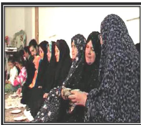
تصویر (۵): میهمانان در شب شیشه

«در گذشته در شب زایمان ولیمه دادن مرسوم بود. عده‌ای مرد و زن از خویشان و آشنایان را برای شرکت در مراسم این شب و خوردن شام به خانه زائو دعوت می‌کردند. مردان در بیرونی و زنان در اندرونی می‌نشستند. یکی از آقایان (آخوندها) را برای شام به خانه دعوت می‌کردند. پس از نام‌گذاری نوزاد، شام می‌آوردند. شیرین‌پلو و قورمه‌سبزی در شب ششم از غذای رسمی و همیشگی بود؛ از این شام به زائو هم می‌دادند و این نخستین بار بود که زائو پس از شش شبانه‌روز غذای سنگین می‌خورد؛ در شب شیشه گذشته از آجیل چند جور «قوتو» نیز درست می‌کردند. در حال حاضر در کرمان تعداد محدودی این مراسم را برگزار می‌کنند و این رسوم را حفظ می‌کنند. اما در بسیاری از خانواده‌ها این باورها و آئین‌ها منسوخ شده است. برخی نیز مهمانان را برای مراسم شب شیشه در تالار به صرف شام و شیرینی دعوت می‌کنند» ۱ .