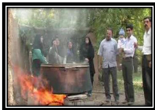
تصویر (۹): پختن آبگوشت عقیقه

در کنار برگزاری این مراسم نان خانگی و معطر نیز پخته می‌شود. نان خانگی ۱ که با داروهای گیاهی مانند گل خشت و سیاه دانه تزیین می‌شود. خمیر نان به شیوه‌ای خاص پهن و سپس بر دیواره تنور زده می‌شود. زنان خانواده پخت نان را انجام می‌دهند. مردان نیز وظیفه پخت آبگوشت عقیقه را بر عهده دارند. در طول زمان برگزاری هر یک از این مراسم، افراد با زمزمه صلوات بر تبرک مراسم می‌افزایند. در این میان پدر و مادر نوزاد حق خوردن آبگوشت عقیقه را ندارند و کراهت خوردن گوشت عقیقه برای مادر طفل بسیار بیشتر است، حتی پدربزرگ‌ها و مادربزرگ‌ها اصلاً از گوشت عقیقه نمی‌خورند.