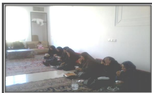
تصویر (۷): حضور مهمانان در مراسم نام‌گذاری