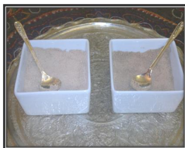
تصویر (۴): قهوه و قوتو

تهیه آجیل برای این شب نیز ضرورت دارد. مهمانان شام صرف می‌کنند و بعد می‌روند و اقوام نزدیک تا پاسی از شب کنار مادر و نوزاد می‌نشینند تا از نوزاد و مادر مراقبت کنند. آنها در این شب خودشان را با آجیل سرگرم می‌کنند تا خوابشان نبرد. چون مانند گذشتگان اعتقاد دارند که باید مراقب مادر و نوزاد باشند و تا اذان صبح بیدار بمانند و به گفتگو و پایکوبی بپردازند تا زائو دچار فکر و خیال نشود و بر روی شیر مادر تأثیر نگذارد. آنها معتقد بودند که زن زائو را نباید تنها گذاشت، زیرا ممکن است آل به زن زائو و نوزادش آسیب بزند. یکی از مصاحبه‌شوندگان این مراسم را این گونه توصیفی می‌کند: