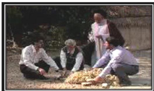
تصویر (۸): خواندن دعای مخصوص برای گوسفند عقیده ۱

اما مراسم عقیده در منزل به این صورت انجام می‌شود که پدر نوزاد عصر روز ششم یا صبح روز برگزاری مراسم عقیده گوسفندی را خریداری می‌کند. گوسفند عقیده باید از هر نظر سالم باشد. آسیب‌دیده، لاغر، لنگ و کور نباشد. باید شاخ‌ها و گوش‌های سالم و سن و سالی بیش از ۶ ماه داشته باشد. پیش از ذبح گوسفند توسط قصاب، یکی از بزرگان خانواده، سادات یا روحانیون دعای مخصوص عقیده را می‌خواند و با طلب فاتحه این مراسم پایان می‌یابد.