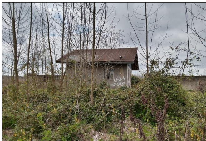
عکس (۳) و (۴): آگهی فروش خانه و زمین (سال ۱۴۰۰)

۱۱ درصد از خانه‌های روستا نیز خالی از سکنه است که برخی از این خانه‌های خالی از سکنه و بدون استفاده، به شهرنشینان تهرانی فروخته شده و برخی نیز در انتظار فروش است و