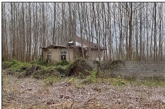
عکس (۵) و (۶): خانه‌های خالی از سکنه و در حال تخریب (سال ۱۴۰۰)