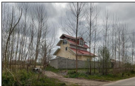
عکس (۱) و (۲): خانه دوم شهرنشینان در روستای میانه (سال ۱۴۰۱)