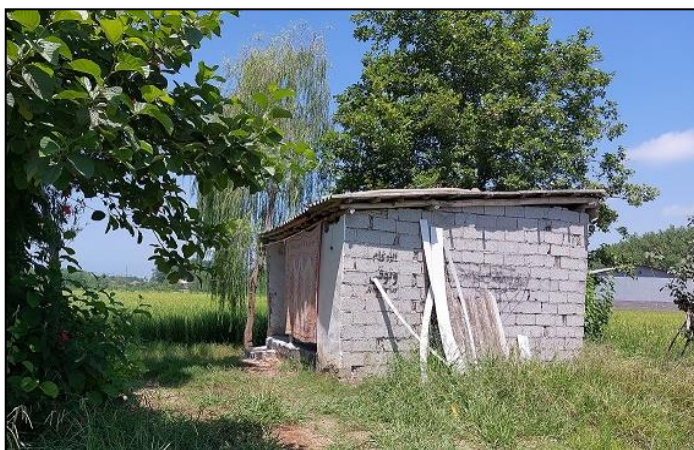
عکس (۷): سکونتگاهی موقت و کوچک در کنار شالیزار (سال ۱۴۰۱)

یکی دیگر از پدیده‌هایی که طی سال‌های اخیر در این روستا رایج شده است، شکل‌گیری سکونتگاه‌های موقتی و کوچک در کنار زمین زراعی است. روستاییانی که خانه خود را فروخته‌اند، ولی در فصل کشاورزی برای انجام فعالیت‌های مختلف در شالیزارها و باغات پیوسته به روستا می‌آیند، نیازمند اقامتگاهی کوچک هستند تا لحظاتی در آن استراحت کنند و برخی لوازم کشاورزی کوچک را در آنجا قرار دهند. این موضوع بیشتر در مورد افرادی مصداق دارد که خودشان با کارگر یا دستگاه نشا زمین‌های خود را به زیر کشت می‌برند. به هر حال کاشت، داشت و برداشت برنج شامل مراحل مختلف و ریزه‌کاری‌های متعددی است که پیوسته سرکشی مستمر به شالیزار به منظور تنظیم میزان آب آن و انجام سایر امور را ایجاب می‌کند. آنها در باغ‌های خود نیز محصولاتی مانند گوجه‌فرنگی، خیار، بادمجان، سبزیجات و ... می‌کارند.