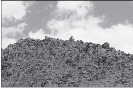
تصویر ۲. تصویری از کوه پیرزنه