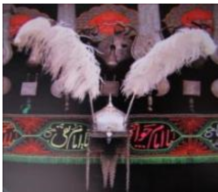
تصویر ۴. نصب پر روی کلاه خود به عنوان تعویذ (طریقی، ۱۳۸۵: ۱۲۳)

نظرقربانی (نفیسی، ۱۳۳۳: ۳۴ و ۳۵) یا چشم قربان (همایونی، ۱۳۴۸: ۳۷۷) را با خشک کردن مردمک چشم گوسفند قربانی و کشیدن آن به ریسمان به همراه مهره‌های دیگر درست می‌کنند و به لباس شخص، بویژه کودک و گاه حیوانات و جمادات، وصل می‌کنند (نفیسی، ۱۳۳۳: ۳۴-۵).