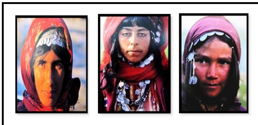
تصویر ۱۰. تعویذ زنان عشایر قشقایی با «سکه» به صورت تزئینات سربند و گردن‌بند (kasraian, 2002: 179&252)

به هم می‌کوبند. در جهازها و لنج‌های ایرانی نیز با دیدن سایه ببادریا، کارد کهنه‌ای را تند تند روی لنگر جهاز می‌کشند و اعراب فریاد برمی‌دارند: حدید، حدید (ساعدی، ۱۳۵۵: ۱۰۵). سکه‌های فلزی نیز از دیگر اشیای فلزی هستند که مردم برای آنها نیرویی قائلند. در جامعه روستایی و عشایری ایل قشقایی، زنان از سکه‌های فلزی، برای دور کردن ارواح شیطانی و دفع چشم شور از خود استفاده می‌کنند. به این منظور گردن‌بندها و سربندهایی را می‌سازند و سر و گردن خویش را با آنها زینت می‌دهند و نیز رشته‌هایی بلند از این سکه‌ها می‌سازند و به گیسوان بلند و بافته خود می‌آویزند (Kasraian, 2002: 244).