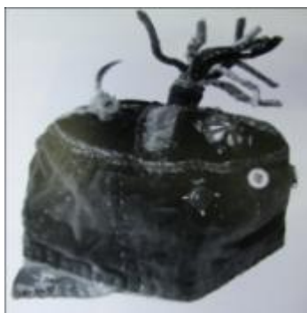
تصویر ۵. پنجه پرنده به عنوان تعویذ دفع چشم‌زخم روی کلاه یک پسر بچه از عشایر لرستان (Mortensen, 1993: 347)

نظرقربانی (نفیسی، ۱۳۳۳: ۳۴ و ۳۵) یا چشم قربان (همایونی، ۱۳۴۸: ۳۷۷) را با خشک کردن مردمک چشم گوسفند قربانی و کشیدن آن به ریسمان به همراه مهره‌های دیگر درست می‌کنند و به لباس شخص، بویژه کودک و گاه حیوانات و جمادات، وصل می‌کنند (نفیسی، ۱۳۳۳: ۳۴-۵).