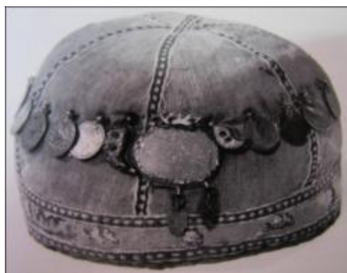
تصویر ۱۱. نصب سکه روی کلاه پسرپچه‌ها جهت دفع چشم‌زخم در لرستان (Mortensen, 1993: 349)

زنان عشایر لر نیز بنا بر باورهای دیرینه خود، برای مصون نگه داشتن فرزندان خویش از گزند چشم‌زخم و ارواح شریر لباس‌های آنها را با سکه‌های فلزی می‌آرایند (Mortensen, 1993: 349).