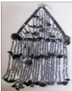
تصویر ۶. اسفندی، طلسم ساخته شده از گیاه اسفند جهت دفع چشم‌زخم (Mortensen, 1993: 239)

مراسم اسفندگردانی با ریختن دانه اسفند در آتش و خواندن وردهای موزون شعرگونه همراه است. واژگان وردها در خرده‌فرهنگ‌های ایران تفاوت‌هایی دارند، ولی همگی یک عقیده و پنداشت عمومی را با رمز و نشانه می‌رسانند (بلوکباشی، ۱۳۸۹: ۴۵۸-۴۵۹). وردها عموماً این‌طور آغاز می‌شود: «اسفند و اسفند دونه / اسفند صد و سی دونه». وردها معمولاً با عبارت «بترکد چشم حسود و حسد و بخیل و بیگونه» یا عبارت‌هایی شبیه آن پایان می‌یابد (مردانی، ۱۳۴۸: ۳۵). در شهرستان اردستان، بخصوص شب‌های یکشنبه و چهارشنبه، در مراسم اسفندگردانی و دودکردن آن می‌گویند: «بترکد چشم حسود و حسد و دیده کافر» یا «بر چشم بد لعنت و بر دین محمد(ص) صلوات». برای بهبود نظرخورده، به نام تک تک اقوام و خویشان و همسایه‌ها و همه کسانی که ممکن است مریض را چشم زده باشند، به دانه اسفند سوزن می‌زنند. پس از پایان اسامی، برای هر روز هفته نیز که شخص در آن روز متولد شده باشد، سوزنی به دانه اسفند می‌زنند: «شنبه‌زا، یکشنبه‌زا ... تا جمعه‌زا». بعد چنین می‌افزایند: «همسایه دست‌راستی، همسایه دست‌چپی، همسایه پشت‌سر، همسایه پیش‌رو، الهی بترکد چشم او». بعد اسفندها را دور سر مریض می‌گردانند و روی آتش آماده روی خشت می‌ریزند و می‌گویند: «اسفند و سه بند / صد و سی چشمو ببند / چشم حسد و حسود و هر هیز و لوند» (هاشمی، ۱۳۷۰: ۵۳۴). باور دارند دانه اسفند، فتیش، همان چشم‌شور است و با سوراخ کردن آن، چشم فرد شورچشم نیز سوراخ می‌شود، صدای ترکیدن دانه اسفند در آتش نیز در خیال آنها ترکیدن چشم حسودان و چشم‌شورهاست.