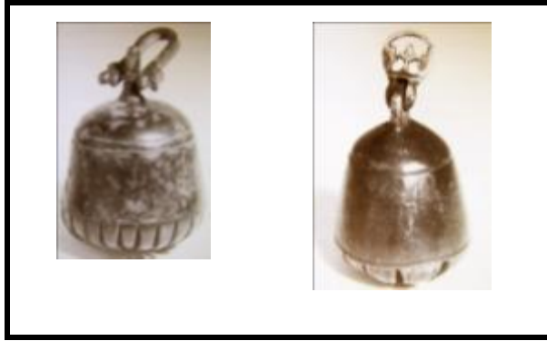
تصویر ۸. دو نمونه از زنگوله‌های مورد استفاده جهت دفع چشم‌زخم (Allan, 2000: 325)

در بسیاری از شهرهای ایران از دیگر دست‌ساخته‌های فلزی چون انواع زنگ و زنگوله برای دفع چشم‌زخم یا طرد ارواح خبیث استفاده می‌کنند. زنگ‌ها و زنگوله‌های آویخته شده بر گردن حیوانات اهلی و بارزش می‌تواند جلوه‌ای از این کارکرد باشد (تصویر ۸).