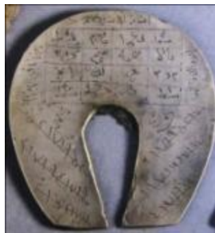
تصویر ۷. نعل اسب با نوشته‌ها و علائم روی آن بالای در ورودی، جهت خوش‌یمنی و رد نحوست در بوشهر (Perk, 2010: 15)

نعل اسب نیز از جمله اشیای فلزی است که هاله‌ای از باورها به دور آن تنیده شده است. در بوشهر هرگاه کسی در اثر پیشامد حادثه یا شنیدن خبر ناگواری بشدت مضطرب شود و ترس شدید به وی دست دهد، نعل اسب را روی آتش داغ می‌کنند و در پیاله‌ای جای می‌دهند و با ریختن کمی آب روی آن، فرد مورد نظر را به خوردن آب روی نعل و می‌دارند. آنها بر این باورند که چون در اثر ترس شدید، ارواح خبیثه در روح آن شخص حلول می‌کنند، انجام این کار به وسیله نعل آهنی باعث رانده شدن آنها می‌شود. آنها به طور کلی، نعل اسب را نشانه خوش‌یمنی و رد نحوست می‌دانند و بر اساس همین باور است که آن را روی سر در ورودی حیاط خانه نصب و گاه آن را روی بدنه کشتی و در قسمت جلوی آن می‌خکوب می‌کنند (احمدی ری‌شهری، ۱۳۸۱: ۱۳۸). همچنین اهالی روستای اسک بر این باورند که نصب نعل اسب روی دروازه‌ها و یا ماشین‌ها باعث جلوگیری از چشم‌زخم و موجب خوشبختی خانواده‌ها می‌شود (راعی، ۱۳۸۴: ۲۰۳).