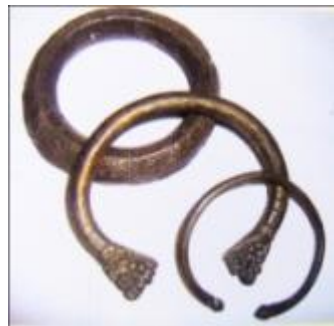
تصویر ۹. خلخال برنجی، مورد استفاده زنان در استان هرمزگان جهت دفع نیروهای شر (خطیبی‌زاده، ۱۳۸۹: ۱۳۰)

استفاده زنان و دختران از زنگوله‌های مدور در ساق پا - که به آن خلخال هم می‌گویند - بخصوص در شهرهای جنوبی ایران، نشانی از بقایای این کارکرد است (درویشی، ۱۳۸۰: ۲۵). در استان هرمزگان خلخال‌هایی از حلقه‌های لوله‌ای توخالی ساخته می‌شود که در هنگام ساختن، چند سوراخ روی آن قرار می‌دهند و از سوراخ‌ها سنگریزه‌هایی در آن می‌ریزند که هنگام حرکت دست‌ها و بازوها صدایی از آن شنیده می‌شود که در باورشان در دفع چشم‌زخم و نیروهای شر مؤثر است (خطیبی‌زاده، ۱۳۸۹: ۹۰).