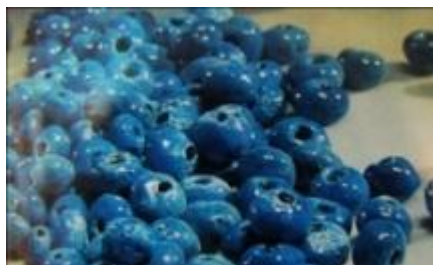
تصویر ۱. خرمهره آبی رنگ از جنس سفال، برای دفع چشم‌زخم (گلاک، ۱۳۵۵: ۵۸)

مردم فراشبند برای دفع شر آل، مهره‌ای به رنگ عسلی و موسوم به مهره آل را که بر روی آن تصویر زنی قرار داشت به همراه مهره مخصوص دیگری به نام تاسه می‌ساختند و در آب مخلوط می‌کردند و به زن زائو می‌خوراندند (سیدرزاق، ۱۳۸۲: ۷۵). مهره مار نیز از دیگر مهره‌های باور شده در میان ایرانی‌هاست که برای به دست آوردن آن آداب پر تفصیلی در هنگام فصل جفت‌گیری مارها انجام می‌شده است (هدایت، ۱۳۳۴: ۵۰). توده عوام اعتقاد دارند داشتن مهره مار، سفیدبختی می‌آورد (همان: ۱۱۱) و هرکس مهره مار داشته باشد، نباید بالای سر بچه ۴۰ روزه برود چرا که بچه جن‌زده می‌شود (همان: ۱۹۴). مهره‌های آبی و سبز و کیود نیز که معمول‌ترین آنها به خرمهره (تصویر ۱) معروف است، برای دفع ضرر شورچشمانی استفاده می‌شود که چشمانی به این رنگ‌ها دارند (مقدم، ۱۳۳۷: ۱۶۲).